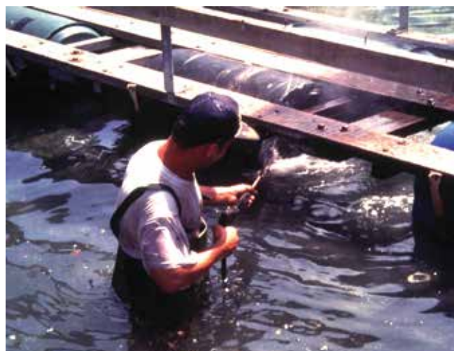
▲ Рис. 11: Оборудование морских ферм может быть очищено на местах посредством высоконапорной промывки.

Для защиты стационарного оборудования для вылова и объектов морского фермерства от загрязнения иногда могут