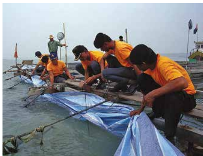
▲ Рис. 13: При заблаговременном оповещении о разливе вокруг рыбных клеток может быть навешена пригруженная полимерная пленка с целью защиты от загрязнения плавающей нефтью.