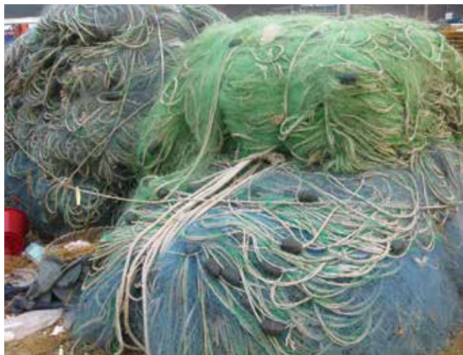
▲ Рис. 5: При несильном загрязнении нефтью рыболовные сети и верши могут быть очищены, однако в некоторых случаях их замена может быть более оправданной с экономической точки зрения.