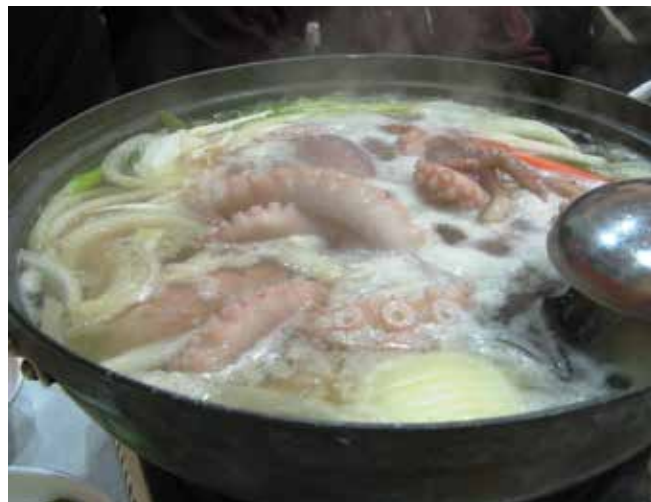
▲ Рис. 9: Морепродукты составляют важный источник белка в рационе жителей многих прибрежных поселений.