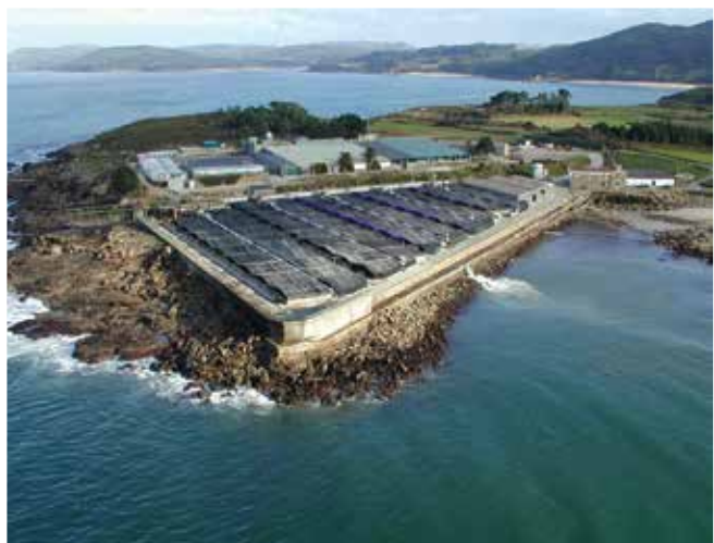
▲ Рис. 7: Береговые рыбобитомники требуют больших объемов чистой морской воды. Водозаборные устройства обычно располагаются ниже водной поверхности и могут загрязняться диспергированной нефтью.

и на мелководье ниже приливно-отливной зоны. В редких случаях в таких условиях также наблюдалась гибель свободноплавающих рыб.