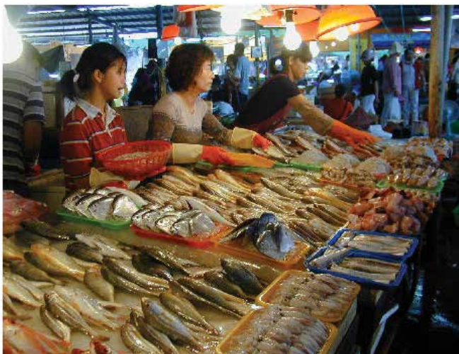
▲ Рис. 10: Рыба для продажи – прерывание коммерческого рыбного промысла может иметь важные экономические последствия для всех участников торговой цепи – от портов стоянки судов до розничных торговцев, как этот рыночный прилавок.

двустворчатых моллюсках <10 мкг/кг (Таблица 1).