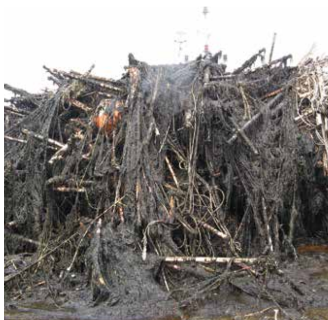
▲ Рис. 12: Сильно загрязненные стойки для выращивания морских водорослей. Они не могли быть очищены до удовлетворительного состояния и поэтому были демонтированы и заменены новыми конструкциями.