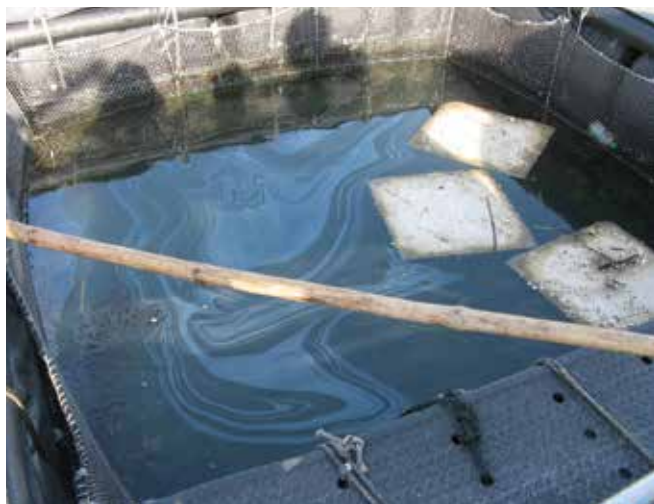
▲ Рис. 14: Загрязнение нефтью фермы по разведению морских ушек. Сорбирующие маты, хотя и не пригодные для удаления большого объема нефти, часто бывают полезными для удаления пленки с внутренних поверхностей рыбных клеток.

использоваться боны и другие физические заграждения. К сожалению, оборудование для рыбной ловли и морского фермерства часто намеренно размещается в зоне миграционных путей рыбы или эффективного водообмена, и такие места обычно характеризуются достаточно быстрым течением, при котором боны становятся практически неэффективными. Расположенные в спокойной воде рыбоводческие фермы иногда могут быть защищены сверхпрочной полимерной пленкой, оборачиваемой по периметру клеток и препятствующей попаданию плавающей нефти на сети или поплавки (Рис. 13). Пленка не должна уходить слишком далеко вниз от поверхности воды и должна быть пригружена по нижней кромке, чтобы предотвратить ее всплытие под действием течения или волн. В некоторых случаях вокруг клеток также могут разворачиваться сорбирующие боны.