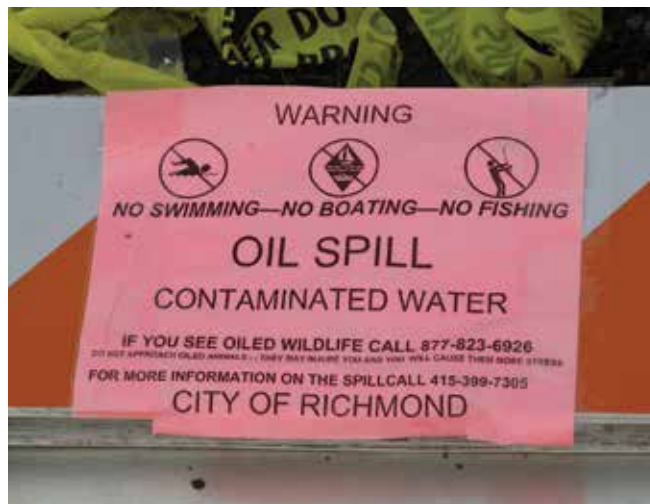
▲ Рис. 15: Для охраны здоровья населения и предотвращения попадания загрязненных продуктов на рынок после нефтяного разлива могут вводиться запреты на рыбный промысел.

Помимо стандартных мер реагирования на разливы, существуют альтернативные стратегии ликвидации аварий: буксировка плавучих объектов в сторону от пути распространения нефтяных пятен, временное заглубление специально сконструированных клеток для прохождения