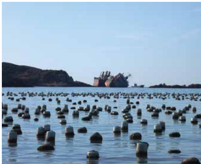
▲ Рис. 2: Ферма по выращиванию морских водорослей – объекты разведения рыбы и выращивания морских культур часто подвергаются воздействию разливов нефти.