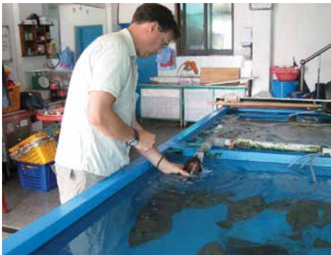
▲ Рис. 18: Отбор проб воды на огороженной береговой ферме. В помощью анализа можно определить возможное загрязнение разводимых особей.