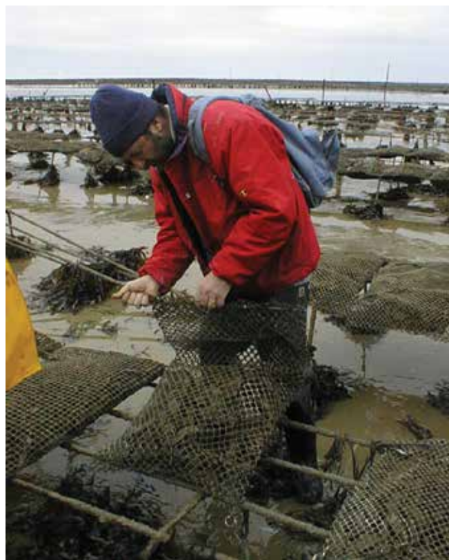
▲ Рис. 16: Сбор образцов устриц. Минимально необходимое для получения надежных результатов число образцов должно определяться отдельно для каждого конкретного случая.

Проведение анализа всех взятых проб может не потребоваться, и некоторые из них могут быть сохранены