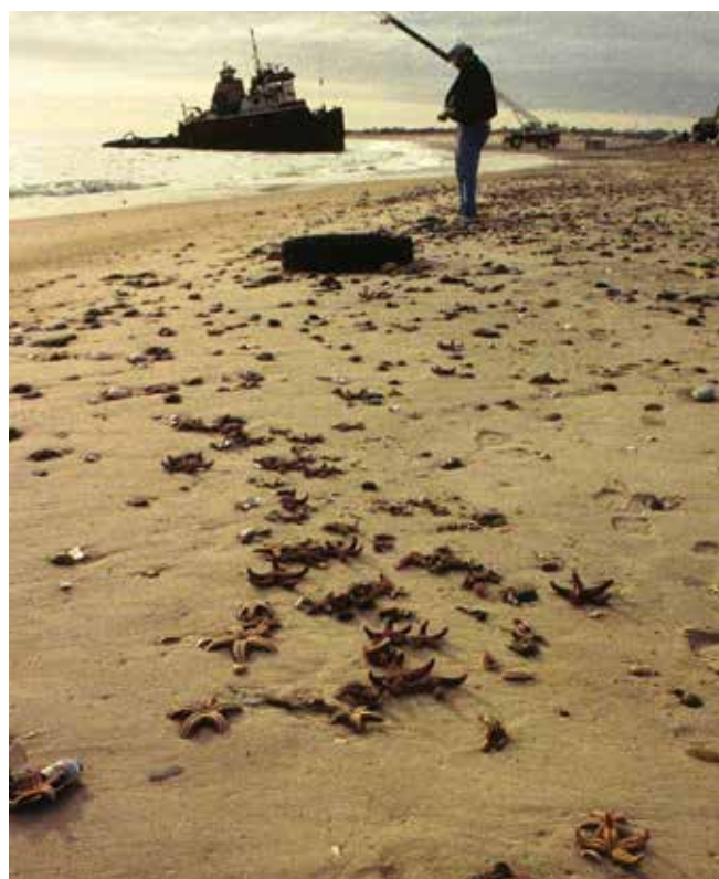
▲ Рис. 4: Лангусты, морские звезды и моллюски пострадали от разлива дизельного топлива, которое естественным путем распространилось на мелководье во время шторма.

Как правило, легкая нефть и легкие нефтепродукты, например, бензин или керосин, отличаются относительно высоким содержанием низкомолекулярных ароматических