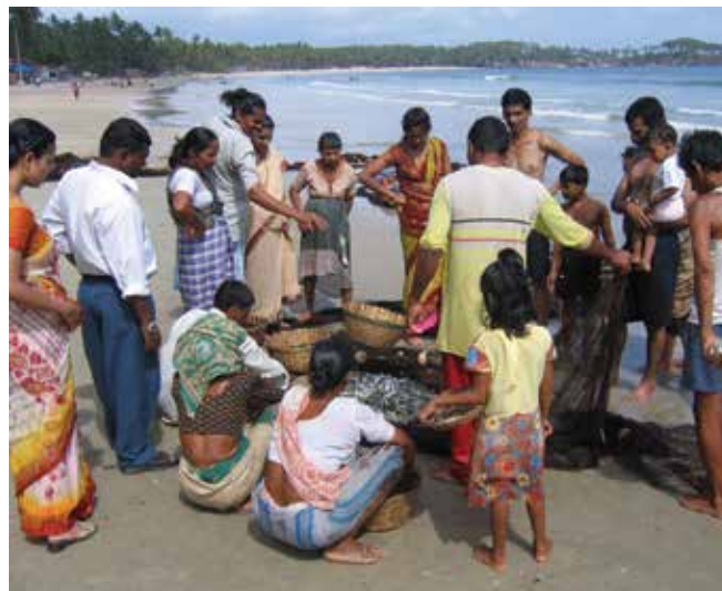
▲ Рис. 3: Существование и доходы небольших прибрежных поселений часто основаны на рыбном промысле, поэтому нефтяные разливы могут серьезно их затронуть.

Сезонные циклы рыбного промысла и морского фермерства изменяются на протяжении года согласно типу вылавливаемых или выращиваемых видов. По этой причине чувствительность видов или мероприятия, предпринимаемые при разливах, также зависят от времени года. Например, урожай некоторых крупных видов морских водорослей, выращиваемых в Азии, собирается весной или в начале лета, и их следующее поколение высаживается ранней осенью. Другие, более быстро растущие виды могут высаживаться несколько раз в год со сбором урожая на протяжении всего года. Выращивание личинок в береговых резервуарах, заполняемых морской водой, также носит сезонный характер и обычно не занимает более нескольких месяцев в течение года.