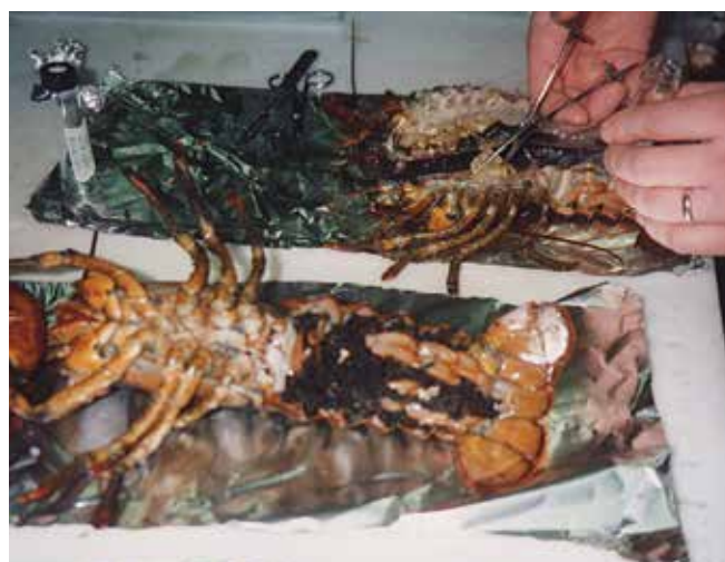
▲ Рис. 17: Рыба и моллюски обычно подвергаются термической обработке на пару перед проведением сенсорного исследования. После приготовления эти лангусты были раскрыты, и белое мясо опробовано по запаху и вкусу на возможность заражения.

для последующего анализа на случай, если первоначальные результаты окажутся неубедительными или ненадежными. Объектами анализа должны быть виды, имеющие коммерческую, рекреационную или важную для рациона ценность, а также те, которые непосредственно употребляются в пищу. Тщательный отбор контрольных проб с близлежащих не пораженных нефтяным загрязнением территорий важен для сравнительных целей и исключения фактора помех от фонового загрязнения. В некоторых случаях отбор проб на местных рынках морепродуктов может предоставить исходную точку для сравнения с пробами, взятыми на загрязненных нефтью участках.