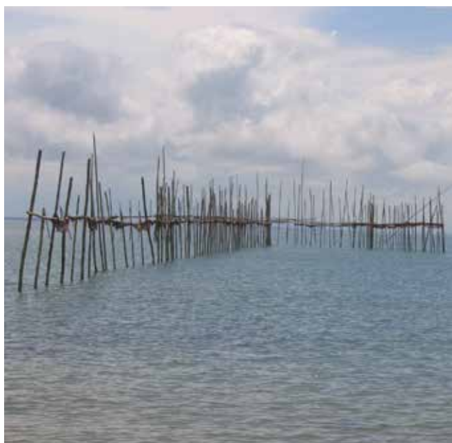
▲ Рис. 6: Рыболовители подвержены загрязнению плавающей нефтью.