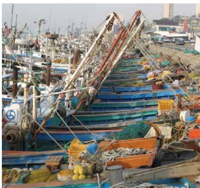
▲ Рис. 1: Рыболовецкий флот может пострадать от разлива нефти в результате загрязнения судов и рыболовных снастей, из-за запрета на рыбный промысел или от обоих факторов, из-за которых он будет вынужден остаться в порту.

Самое высокое воздействие обычно наблюдается вблизи берега, где животные и растения могут физически покрываться и удушаться нефтью или непосредственно