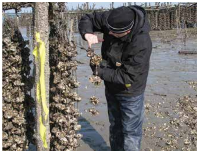
▲ Рис. 19: Процедуры контроля уровней загрязнения, как в случае этих моллюсков, должны включаться в планы ликвидации аварийной ситуации во избежание ненужных запретов на рыбный промысел.

Пробы тканей животных и растений являются скоропортящимися и должны отбираться и храниться надлежащим образом для сохранения их достоверности. Во избежание заражения и взаимного загрязнения образцов должны использоваться чистые емкости для хранения (предпочтительно, стеклянные). Охлаждение или замораживание проб для предотвращения их микробиального разложения за короткое время являются наиболее традиционными способами сохранения проб. Отобранные пробы должны запечатываться, маркироваться и быстро помещаться в изолированную емкость с охлаждающим веществом для перевозки в лабораторию с целью анализа или в камеру замораживания для более длительного хранения. Важно, что согласно некоторым протоколам анализа после длительного периода хранения даже замороженные пробы теряют свою полноценность.