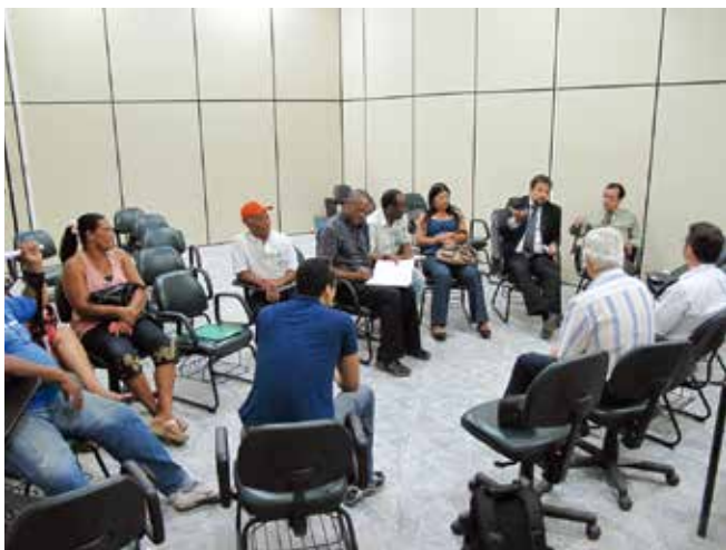
▲ 図9:被害を受けた一般の人々との対面は、地元の懸念を緩和し、関係を改善するために役立つ場合がある。

ケミカルタンカーまたはコンテナ船など特定の種類の船舶が事故に巻き込まれた場合、バンカー油や、危険物質および有害危険物質（HNS）が流出することがある 10 。たとえ比較的少量でもHNSは人間の健康に重大な危険を及ぼす可能性があり、結果として地元住民への危険を意味する。同様に、HNSが