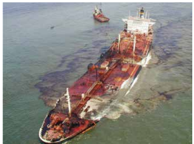
▲ 図1: 重大事故が起きた場合、対応における統率、指揮、管理の質が対応の有効性を決定付ける。

効果的な組織構造を確保するためには、地域および国の緊急時対応計画に規定されている人員の役割や責任を、一連の訓練を通じて定期的かつ徹底的に検証しなければならない。これによって、予見できない問題が生じるような非常事態にあっても、対応要員は急速に変化する状況の重圧に的確に対処することができるようになる。