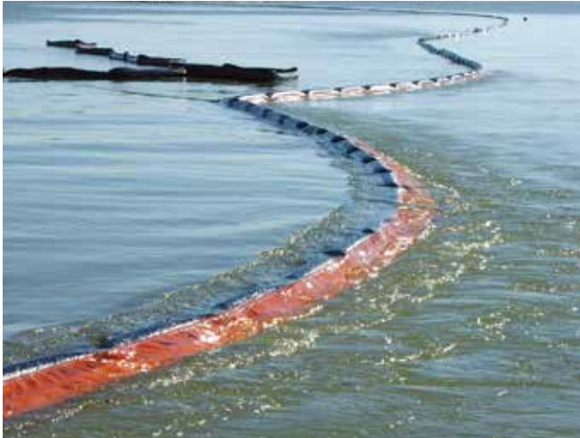
▲ 図4: 資機材やそれらが配置される環境の制約を十分に把握しておくことで、効果がないことが予測される活動に時間や労力を無駄に使わなくて済むようになる。この写真では、海流が速いとオイルフェンスは油を包围できないことがわかる。

国家緊急時対応計画にかかっており、ここでは政府と船主(またはP&I保険会社)がどのように協調すべきかが示されている。船主主導の対応の場合、緊急時対応計画は誰がどのように決断を下すかだけでなく、それぞれの関係者がどの資源を提供すべきかを示す必要がある。船主主導の対応を支援するための規則や緊急時対応計画、後方支援が整っている場合、必要な対応組織(油流出対応請負業者や船主が組織する地元団体、または彼らに代わって対応管理業務を請け負う流出管理チームなど)も整っている可能性が高い。そのような場合、最大の効果を得るためには、政府機関と船主団体との間で優れたコミュニケーションが必要となる。