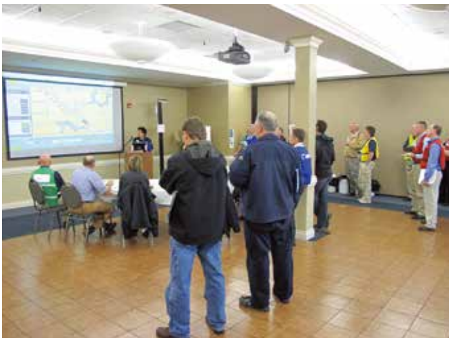
▲ 図6: すべての関係者が確実に状況を把握し、今後の作業について議論し計画を立てるためには、定期的に対応チームで会議を開くことが極めて重要である。