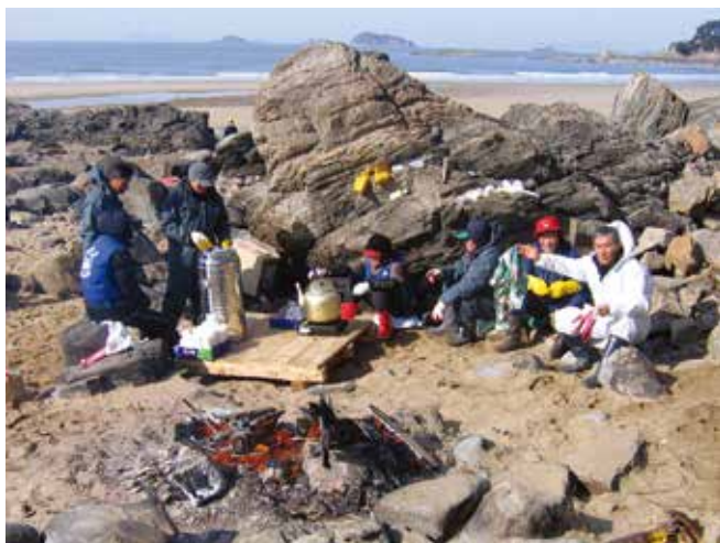
▲ 図7:へんぴな場所で作業する作業員たちへの食料や暖、シェルターなどの供給は、後方支援チームにとって難題となる場合がある。

重大な流出の場合、作業をそれぞれの機能ごとに専門家チームに委託することで対応作業は効果的に運営される。しかし、この作業分割によって人工的なコミュニケーションの壁が出来ることがあるため、このリスクを認識し、そのような壁を乗り越える