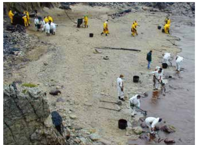
▲ 図2:海岸線の防除作業における責任は、沖の防除作業とは異なる団体に課される場合がある。この写真では、兵士や公共保安作業員たちが乳化した燃料油を海岸線から回収している。

組織構造の実例は多いが、そのほとんどは地元の要望に合わせ、もしくは過去の事故や訓練を通して得た経験や教訓に基づいて発展したものである。一般的な機能構造とチーム別構造(図3a及び図3b)はよくある2つの例であり、この2つの主な違いは特定の活動に関わる指揮または管理の分担および所在である。