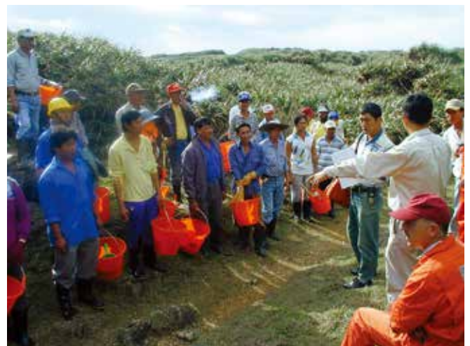
▲ 図8: ボランティアは自分たちの業務の目的および安全衛生の問題について確実に把握した上で作業できるよう、適切な説明を受けなくてはならない。

他の対応要素と同じように、国際補償体制の下で妥当と見なされるためには、野生生物リハビリに関連する経費は被害の規模に釣り合わなくてはならない。