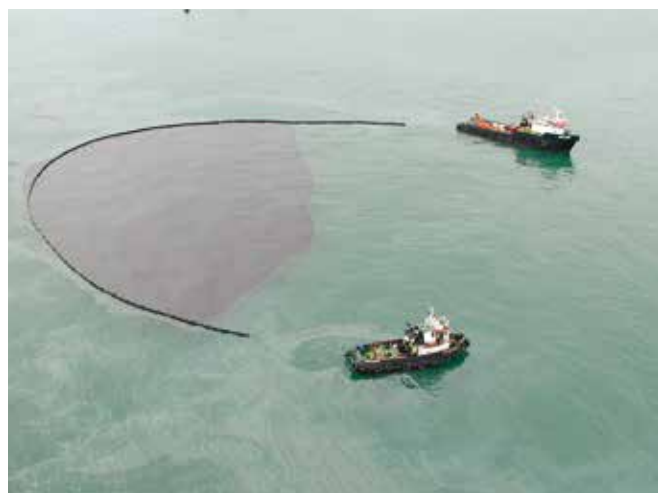
▲ 図5: 油を包囲することに成功しているが、海面から油を回収する手段や一時的に保管する場所がなければ、これらの労力が無駄になってしまう可能性がある。