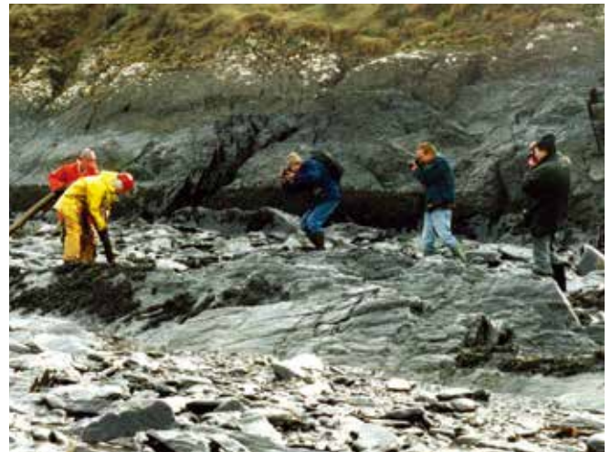
▲ 図10:メディアは重要な役割を担うことがあるが、対応活動の妨げになってはいけない。

事故に対する社会の認識や懸念、関心は、商業組織や非営利団体からの斬新な対応案の自主的な提供や資機材および物資の提供を積極的に促すことにつながる場合がある。これらの申し出をモニターし迅速に対応することは重要であるが、これによって増える仕事量がコールセンターや管理人員に大き