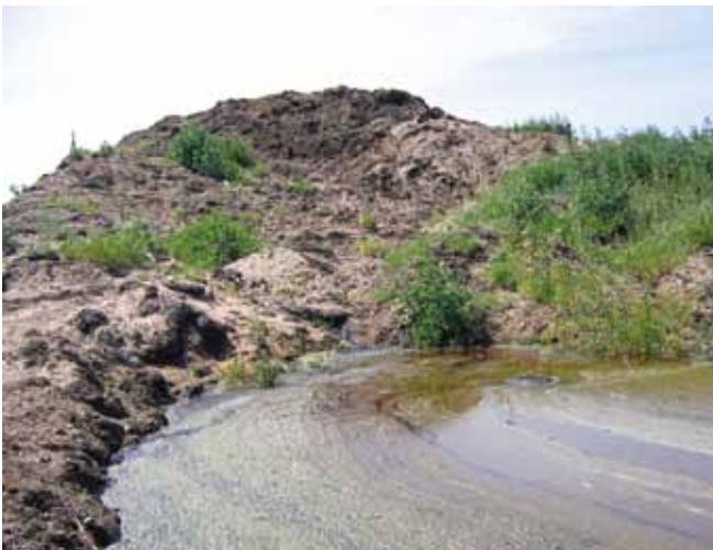
▲ 图 13：捕获和处理堆积在临时储放地的沾油砂粒中的沥出物能防止对周围环境和地下水造成二次污染。