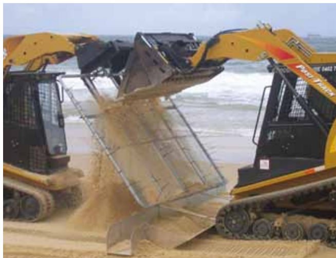
▲ 图 17：以机械方式将油块从砂中筛分出来，以减少产生的废物量。