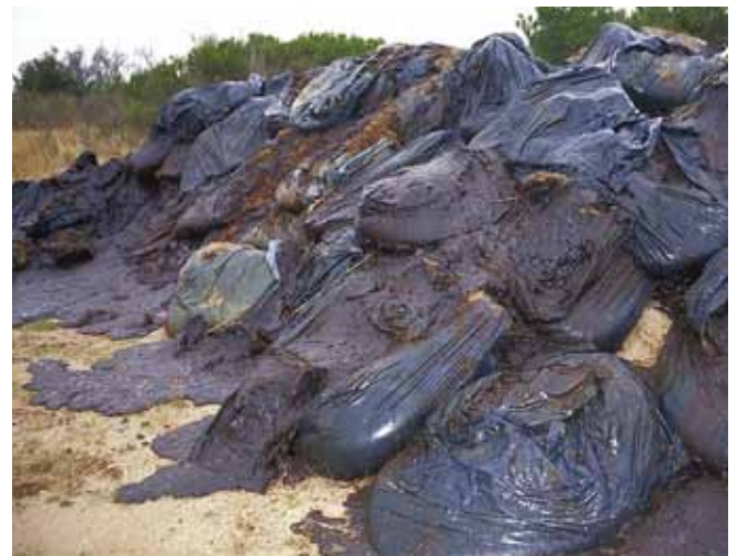
▲ 图 12：塑料袋长期暴露在阳光下导致的降解可能会造成再次污染。