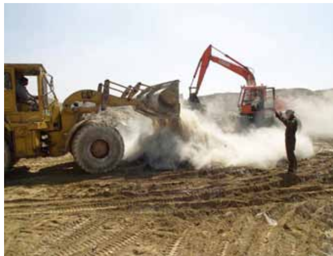
▲ 图 18：使用生石灰固化含油废物。