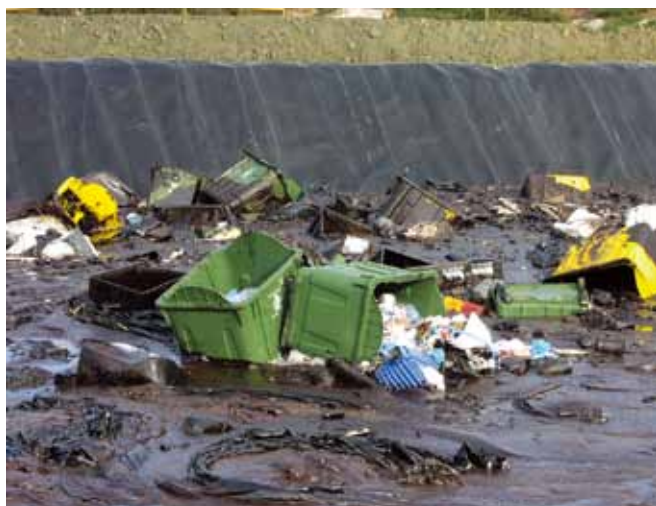
▲ 图 9：配有良好内衬的储放坑中容纳着未很好分离的废物，需要进行大量额外的工作来进行分离和处理。