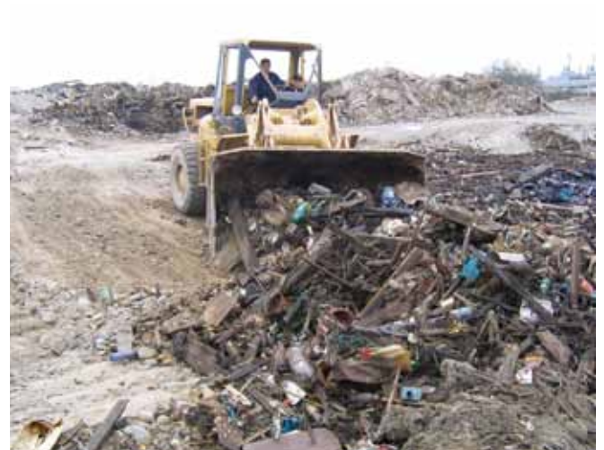
▲ 图 14：在油类上岸前从海岸线清除残片将帮助减少需要弃置的沾油材料的数量。