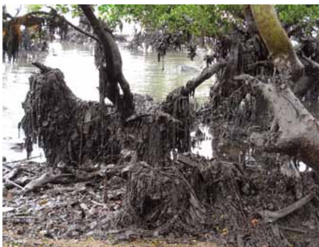
▲ 图 3: 来自落船集装箱的废塑料，混合在油中，搁浅在红树林里。

清理之后需要弃置的大量废物经常会在装卸和运输期间带来重大的物流问题。为了让清理作业无阻碍地继续，通常有必要将材料临时存放，以在收集和最终处理和 / 弃置之间提供缓冲。这样也能给政府机构选择适合的废物处理方法（如果尚未确定）争取时间。对于海岸清理产生的废物，通过将废物储放在高于高水位线位置的后方海滩（图 8），实现了分两个阶段开展运输工作：从海滩上的主储放位置到中转储放位置，再最后到最终处理和 / 或弃置位置。通过这样，可以限制从海滩开始的第一阶段运输涉及的车辆数量，从而降低污染道路的风险。