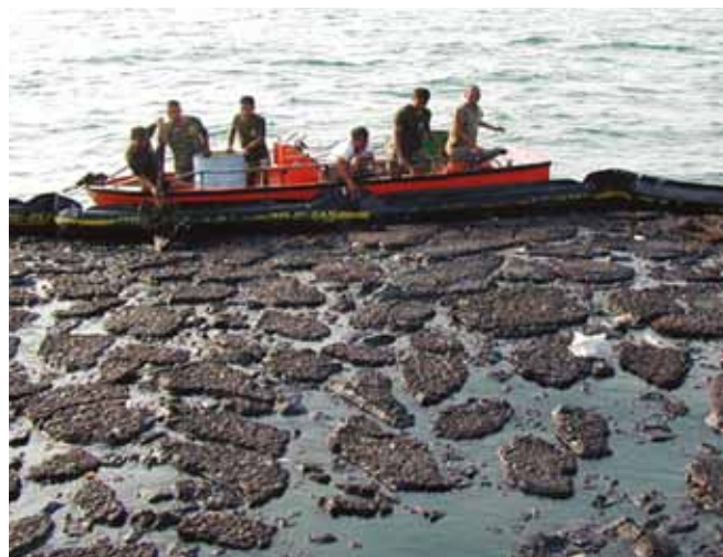
▲ 图 6: 围在浮木档栅内的半固体油类。难以抽吸的油类可能会限制可供选用的弃置渠道。