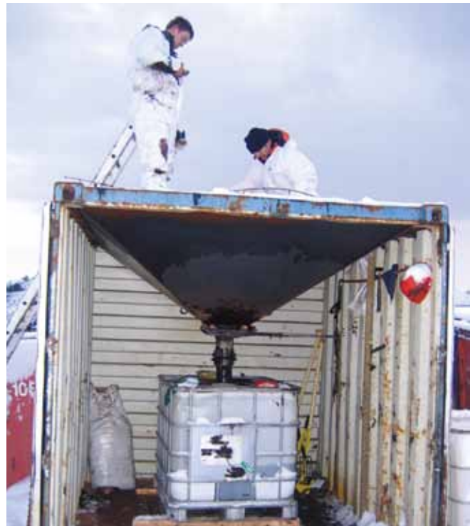
▲ 图 16: 一个简易废物过滤系统, 回收油流过带格子的漏洞来滤除残片。

可能可以就地受污染的海滩泥沙中回收油类。例如, 可以利用围绕储放区域的沟渠或堤岸围堵从回收的海滩泥沙和残片中渗出的油类。然后可以用水冲洗沾油海滩泥沙来释放油类, 有时候还可以结合使用合适的溶剂 (如用柑橘提取的清洁剂)。可以使用低压软管来进行冲洗, 从而让油从存放在临时储放坑中的残片释放和析出。然后可以抽吸得到的油 / 水混和物, 以进行后续的比重分离。另一个方法是将污染的材料放在铁篦子或铁丝网上, 让油滴入放在下面的槽车或罐子中 (图 16)。可以通过用水冲洗废物来帮助此过程的进行, 不过这样可能会产生大量含油的水。还可以通过在封闭的系统