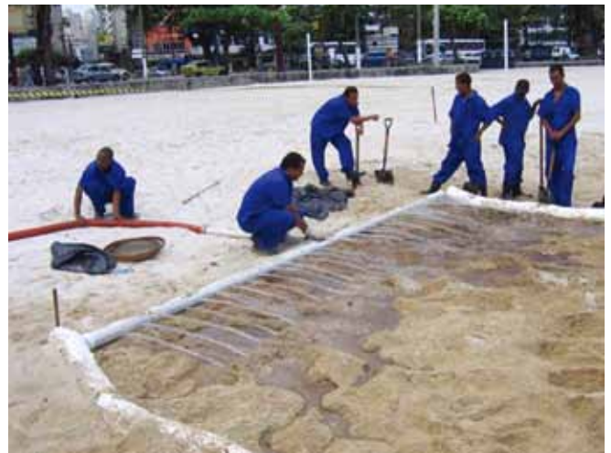
▲ 图 1：通过低压冲洗就地清洁沾油砂粒，并相应地部署吸油浮木档栅来捕获释放出的油类。

“废弃物管理架构” (Waste Hierarchy) 是用于对废物管理选项进行分类和优先排序的成熟国际框架，适用于所有形式的废物的废物，同样也可作为油类泄漏的废物管理的基础。此管理架构包括按照期望度排序的五个不同步骤：