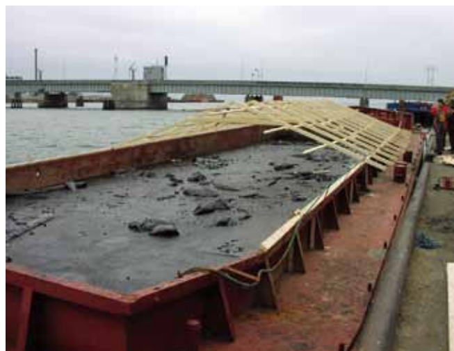
▲ 图 10：储放在驳船中的回收油。需要配盖子来防止雨水进入