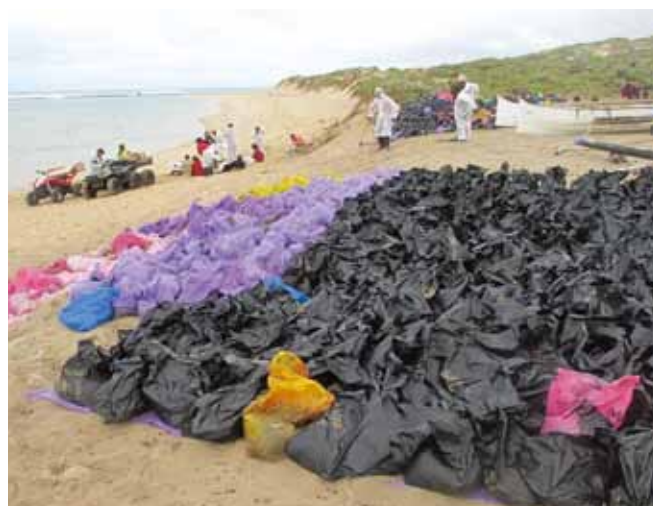
▲ 图 8：围堵沾油海滩泥沙的塑料袋临时储放在高水位线以上，并使用塑料板控制任何沥出的油类。