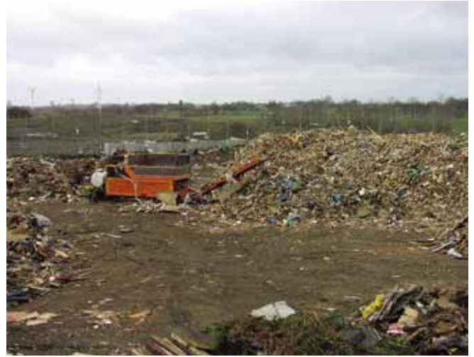
▲ 图 20：填埋废物设施在严密控制的条件下，可以将油浓度低的废物与生活废物填埋在一起。

根据通常的惯例，用于处理生活废物的焚化炉不适合用于大量油类的弃置，因为来自海水中的氯化物可能会导致焚化炉基础腐蚀。在某些设施中可以接受将含油废物与其它垃圾一同弃置，但将需要谨慎考虑含油和不含油废物的量，以控制焚化温度（图 19）。沾油防护服、吸油物、编网或含油量较低的其它材料经常以这种方式处理。高温工业废物焚化炉虽然对盐类的耐受能力可能较高，但数量有限，而且可能位于所在国家/地区的偏远位置。而且此类设备可能没有足够的处理能力来快速处理随大量含油废物而来的额外负担。不过，如果有长期储放设施可用，可以逐步将含油废物逐步加入废物流中，这可能是一个可接受且有效的弃置渠道。