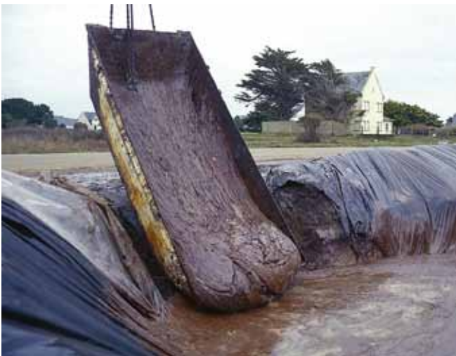
▲ 图 11：槽车将乳化的燃油导入带内衬的临时储放坑中。

弃置工作经常会因随油类一起回收的残片的量而变得复杂。通过海岸调查确定残片自然情况下聚集的位置，通常可以指示油类可能上岸的位置。有时候可以抢在油类达到之前从海岸线