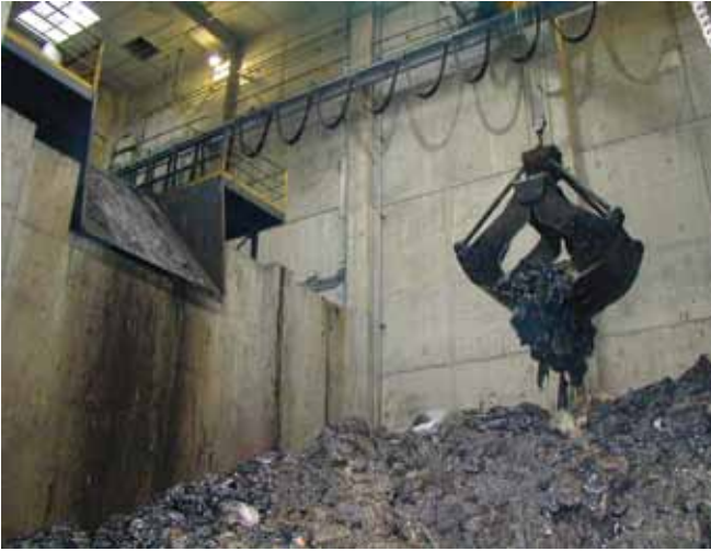
▲ 图 19：袋装沾油废物送入大型工业焚化炉的装载槽中与生活废物一起弃置。