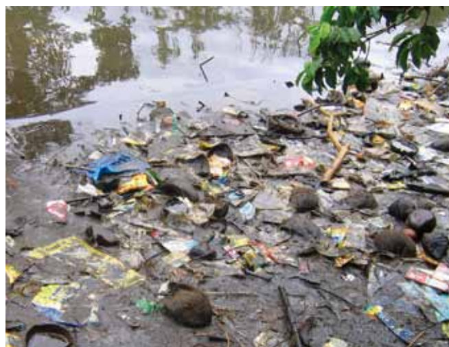
▲ 图 4: 与丢弃的塑料、生活垃圾、木材、植物和其它废物混合的油类。