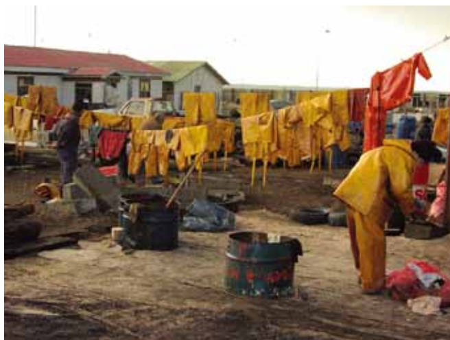
▲ 图 2：最大限度减少废物是泄漏应对措施中非常重要的一个注意事项。应该尽可能清洁和重复使用个人防护设备 (PPE)，包括衣物。

术上可行时（表 1），成本效益可能成为弃置渠道选择时的一个重要因素。不过，就性质而言，油类泄漏通常是是需要快速采取应对措施的