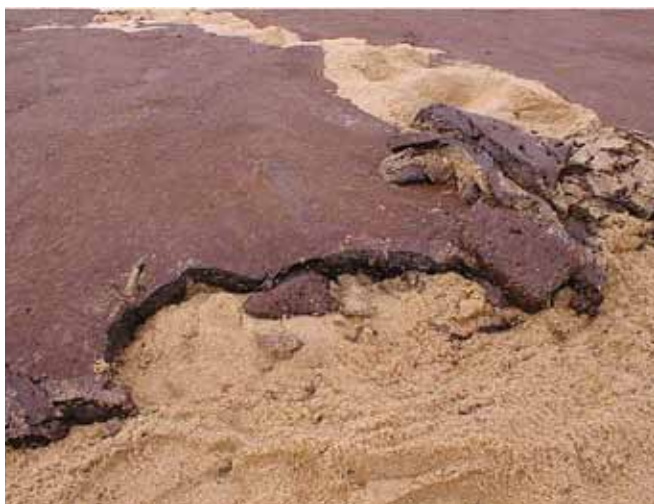
▲ 图 5: 搁浅在沙滩上的乳化油类。有选择的手动回收可帮助最大限度减少被清除的干净底层土量。