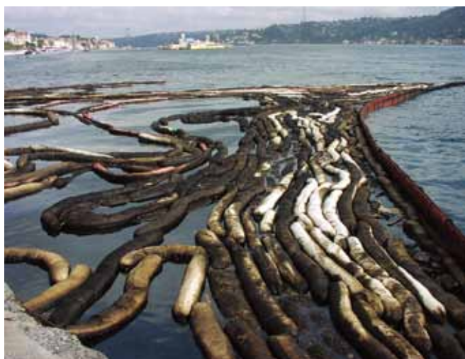
▲ 图 7：部分沾油的吸油浮木档栅。应该避免大规模使用吸油材料，以最大限度减少产生的废物。

应该将塑料袋视为运输含油材料的一种手段，而不是用于储放的方式，因为塑料袋容易在阳光下退化和降解，导致其中的盛装物释放出来（图